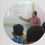
Proses Belajar Di Kelas