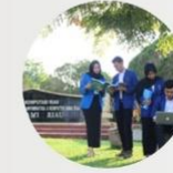
Halaman Depan Kampus