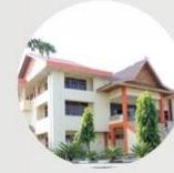
Aula Ykr Convention Hall